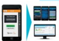
CitiDirect BE® Aplikacja MobilePASS