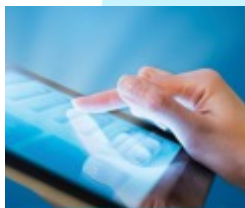
CitiDirect BE® Mobile