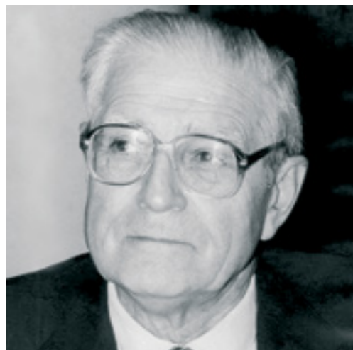
Prof. Aleksander Gieysztor (1916-1999)

Patron Nagrody prof. Aleksander Gieysztor, mediewista, jedna z najwybitniejszych postaci polskiej nauki II poł. XX wieku. Był prezesem Polskiej Akademii Nauk, członkiem Rady Fundacji Kronenberga przy Citi Handlowy, wybitnym polskim humanistą o międzynarodowej sławie, człowiekiem zasłużonym dla kultury polskiej.