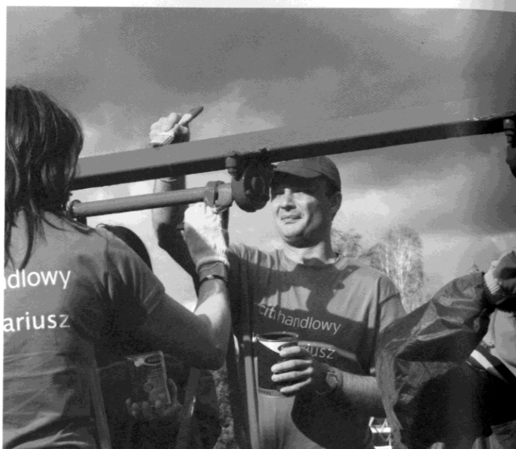
Renowacja placu zabaw w Czarnej Wsi Kościelnej przez wolontariuszy Citi Handlowy

Kolejną drogą rozwoju wolontariatu pracowniczego jest wspólne działanie. Taką okazję stwarza konkurs na projekty wolontariackie. Firma otwiera się w ten sposób na inicjatywy pracowników, umożliwiając im realizowanie autorskich pomysłów. To pracownicy, na co dzień żyjący w środowisku lokalnym, najlepiej dostrzegają jego potrzeby i problemy. Konkurs na projekty to