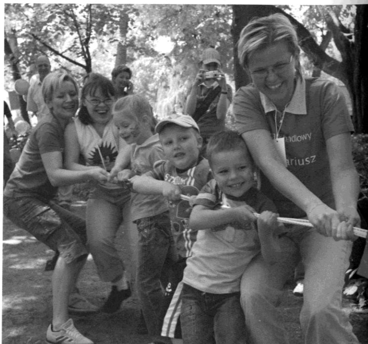
Wolontariusze Citi Handlowy podczas Festiwalu Piosenki Zacczarowanej w Warszawie