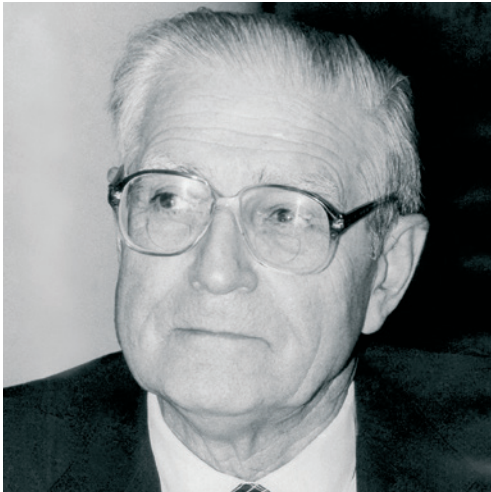
Prof. Aleksander Gieysztor (1916-1999)

Patron Nagrody prof. Aleksander Gieysztor, mediewista, jedna z najwybitniejszych postaci polskiej nauki II poł. XX wieku. Był prezesem Polskiej Akademii Nauk, członkiem Rady Fundacji Kronenberga, wybitnym polskim humanistą o międzynarodowej sławie, człowiekiem zasłużonym dla kultury polskiej.